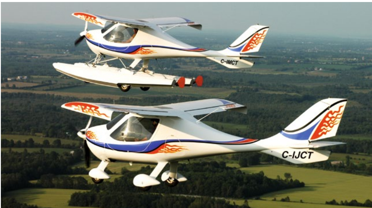
Leichtflugzeug CT, Flight Design GmbH